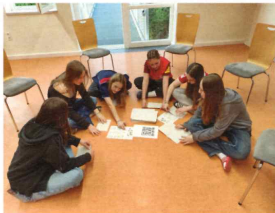
Bild vom Grundkurs 3 in Otterberg